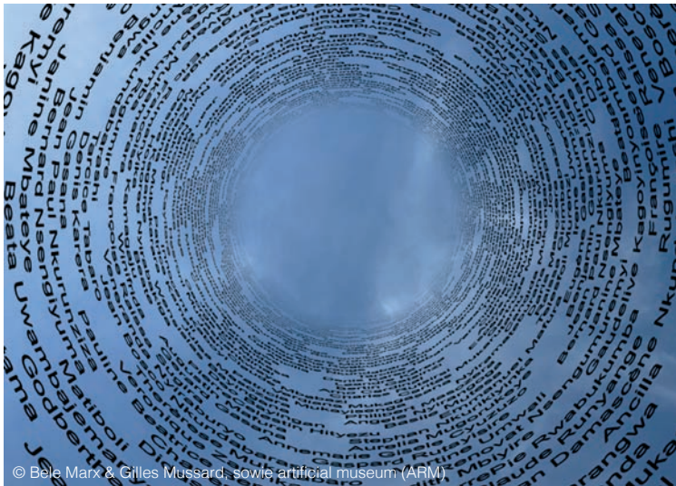
© Bele Marx & Gilles Mussard, sowie artificial museum (ARMI)

Start 28.06.24 17:30 Uhr Yppenplatz, Brunnenmarkt